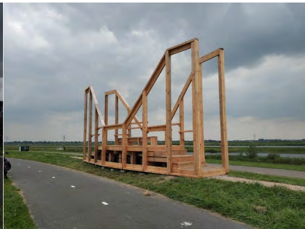
De Rottekijker tussen Pekhuisbrug en de Strandweg

Minder tevreden zijn we met het inhoudelijke standpunt van de gemeente Zuidplas. Alleen omdat wij als bewoners hier massaal tegen zijn komt de Rottekijker er niet. Ondanks dat een goed onderzoeksbureau (Royal Hashkoning DHV) vaststelt dat de betreffende kruising onveilig is en daarvan ook videobeelden heeft, blijft de gemeente denken dat alleen ongelukken mee mogen tellen die geregistreerd zijn bij de politie en dat de Strandweg, Rottekade en Middelweg tot 5000 auto's per etmaal gemakkelijk aan zou kunnen.