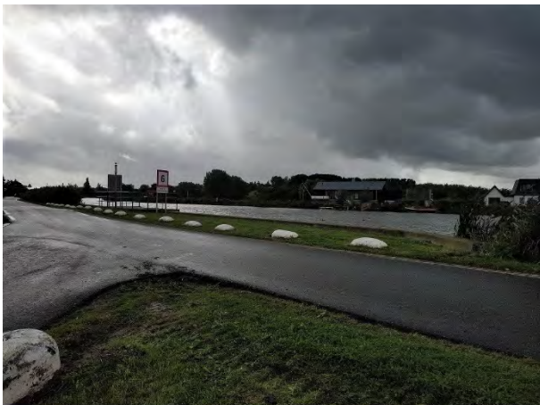
Geen Rottekijker bij het gemaal! en de jachthaven

Dit is een prestatie van formaat en toont aan dat gezamenlijk actievoeren tot resultaten leidt. Hierbij grote dank aan de ondertekenaars, speciaal de ophalers van de handtekeningen, die voor dit prachtige resultaat hebben gezorgd.