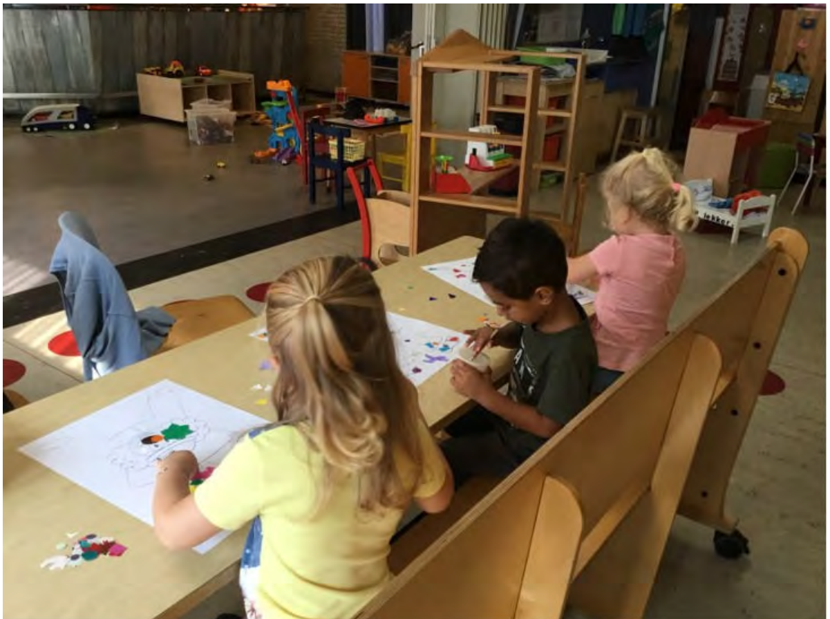
(14) De Vierkap INFO Herfst 2020.