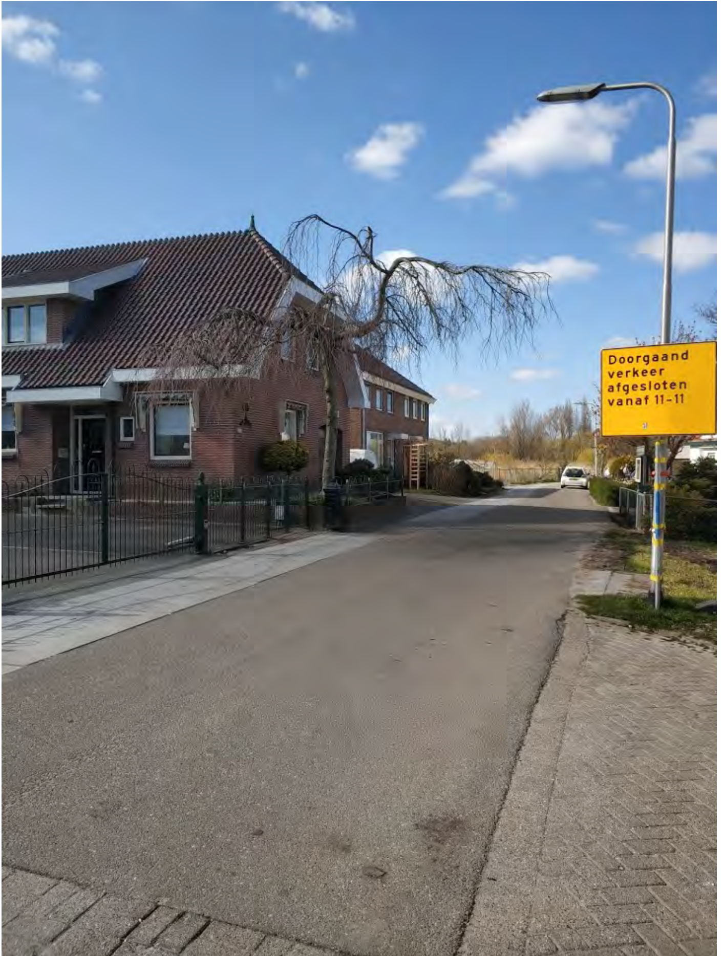
(19) De Vierkap INFO Winter 2019.