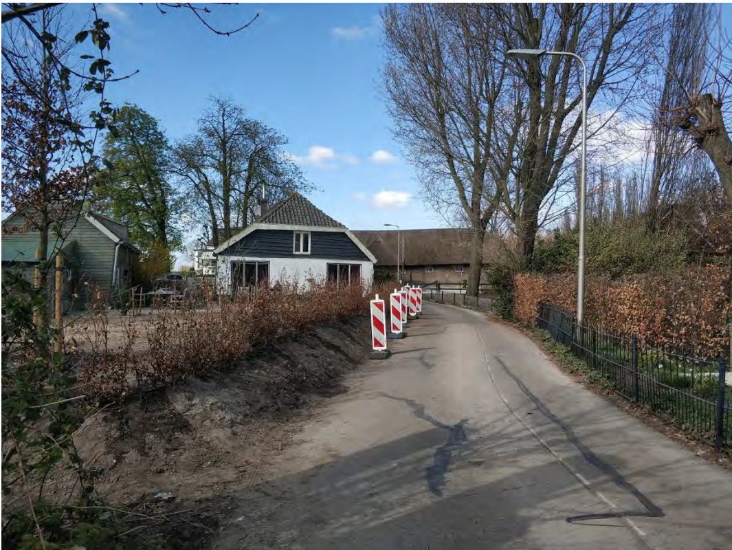
(17) De Vierkap INFO Winter 2019.