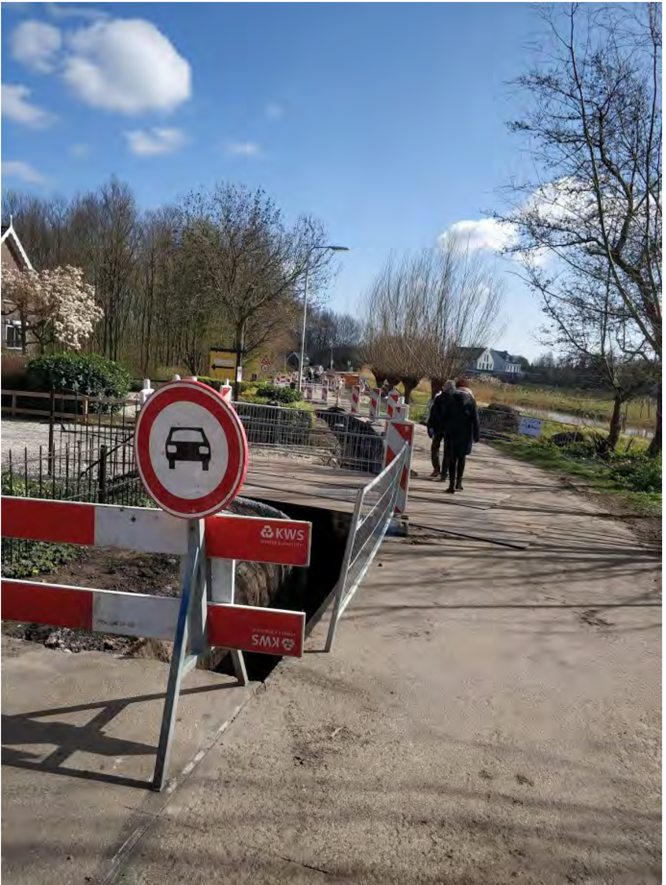
(18) De Vierkap INFO Winter 2019.