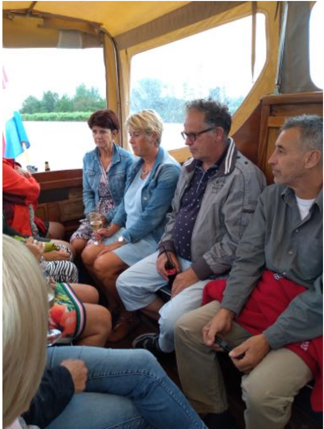
(23) De Vierkap INFO Zomer 2019.