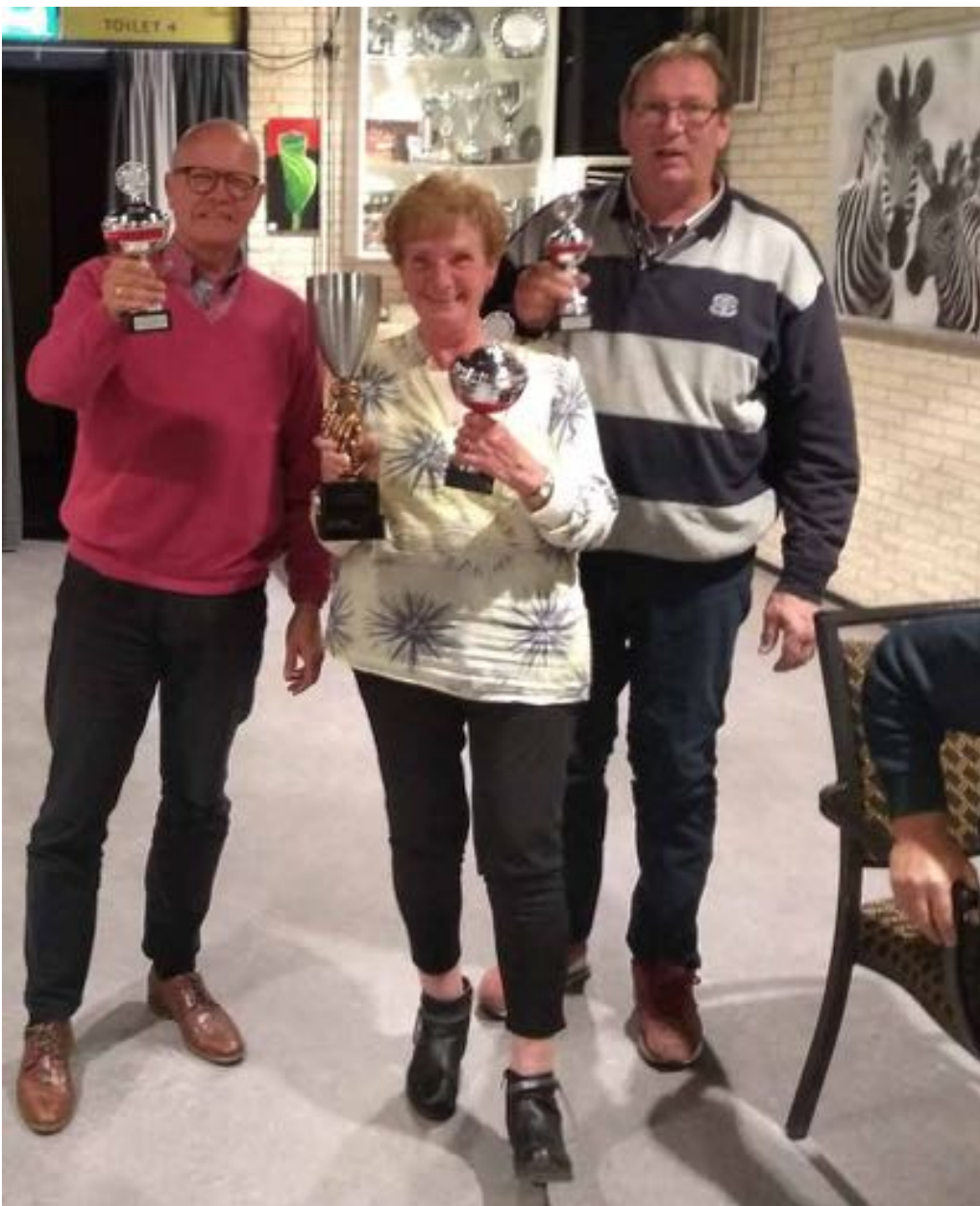
(7) De Vierkap INFO Zomer 2019.