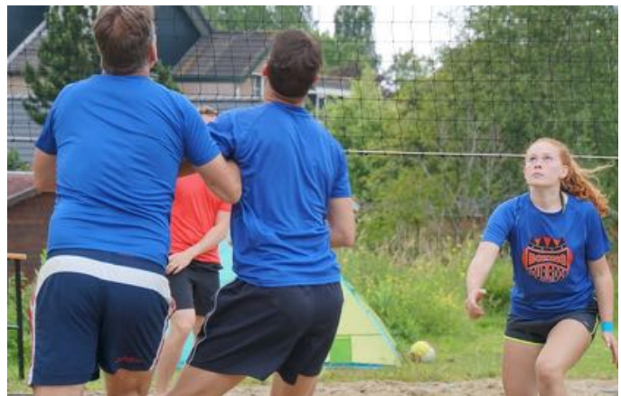
(20) De Vierkap INFO Zomer 2019.