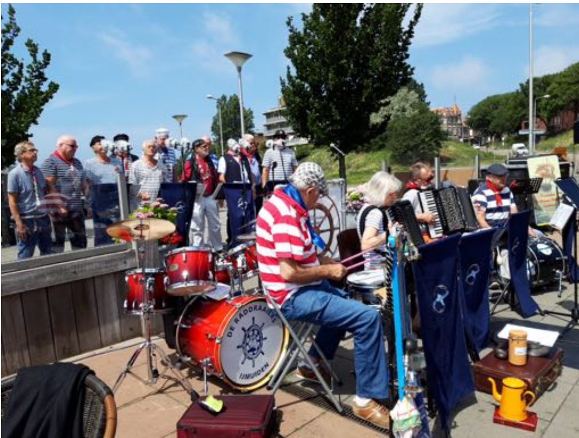
(13) De Vierkap INFO Zomer 2019.