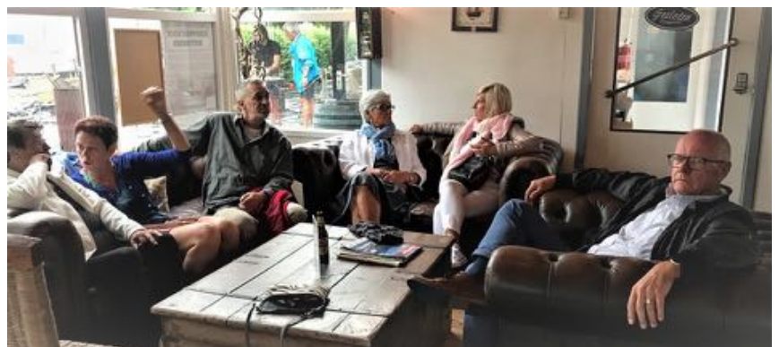
(24) De Vierkap INFO Zomer 2019.