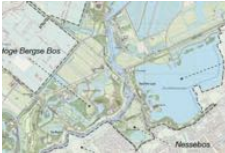
Oud Verlaat in Recreatiegebied Oud Verlaat

Het kader heeft de lange naam: “Ruimte voor een groenblauwe toekomst, kader en koers voor recreatief landschapspark Rottemeren ”. Het gaat over hoe het groene landschap en recreatiegebied ingericht en beschermd moet worden tegen de toenemende verstedelijking. Nu, nadat het kader is vastgesteld, gaan ambtenaren van het Recreatieschap aan de slag om een visie en een ontwikkel— en uitvoeringsplan op te stellen. Dat doen ze samen met zogenaamde stakeholders of belangenbehartigers. Daarna zullen de genoemde gemeenteraden omgevingsplannen vaststellen (nieuwe naam voor bestemmingsplan). Het is de bedoeling dat er dan pas plannen komen die u kunnen raken!