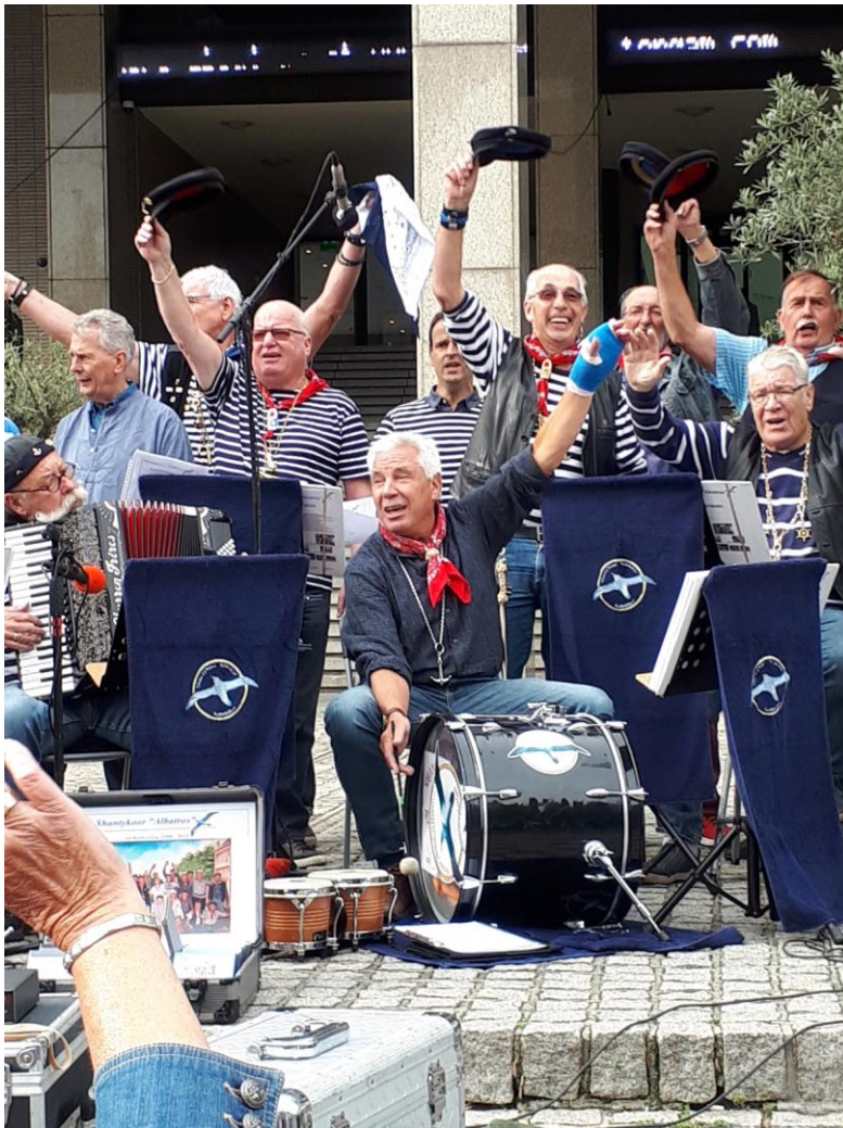
(23) De Vierkap INFO Winter 2018.