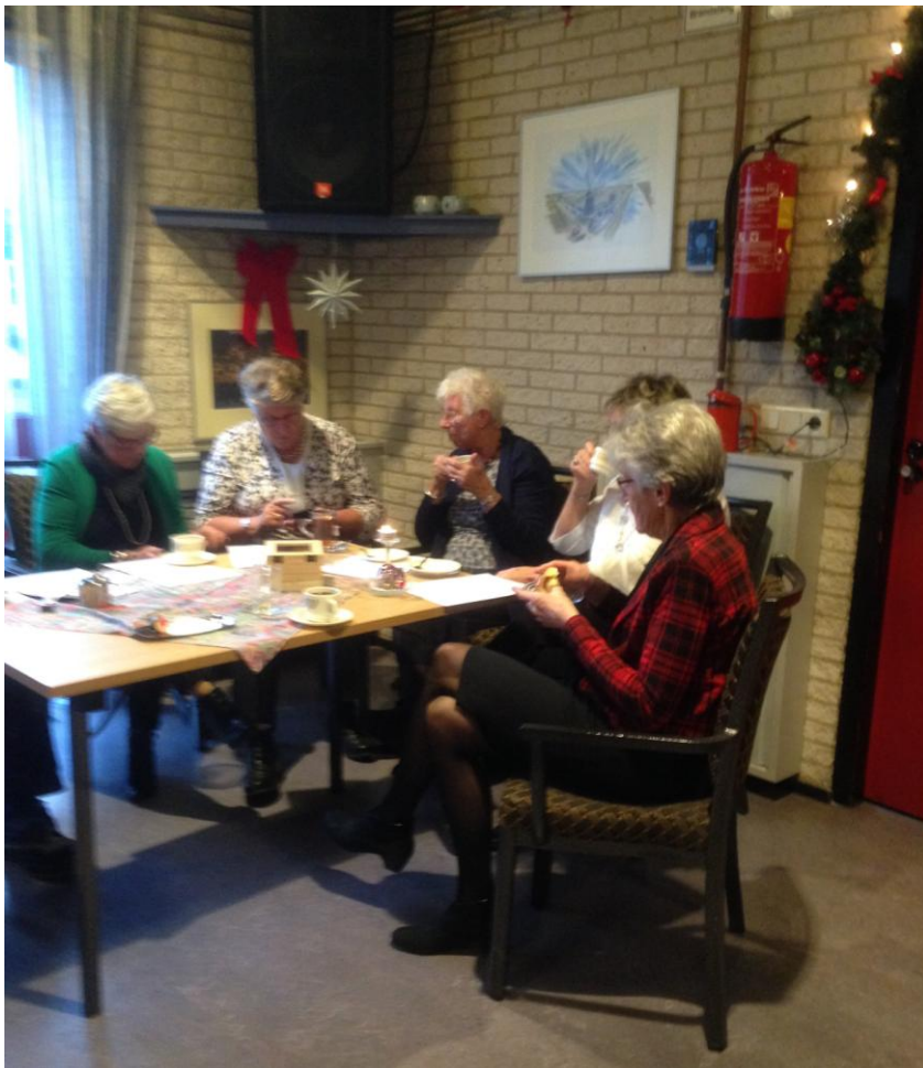
(13) De Vierkap INFO Winter 2018.