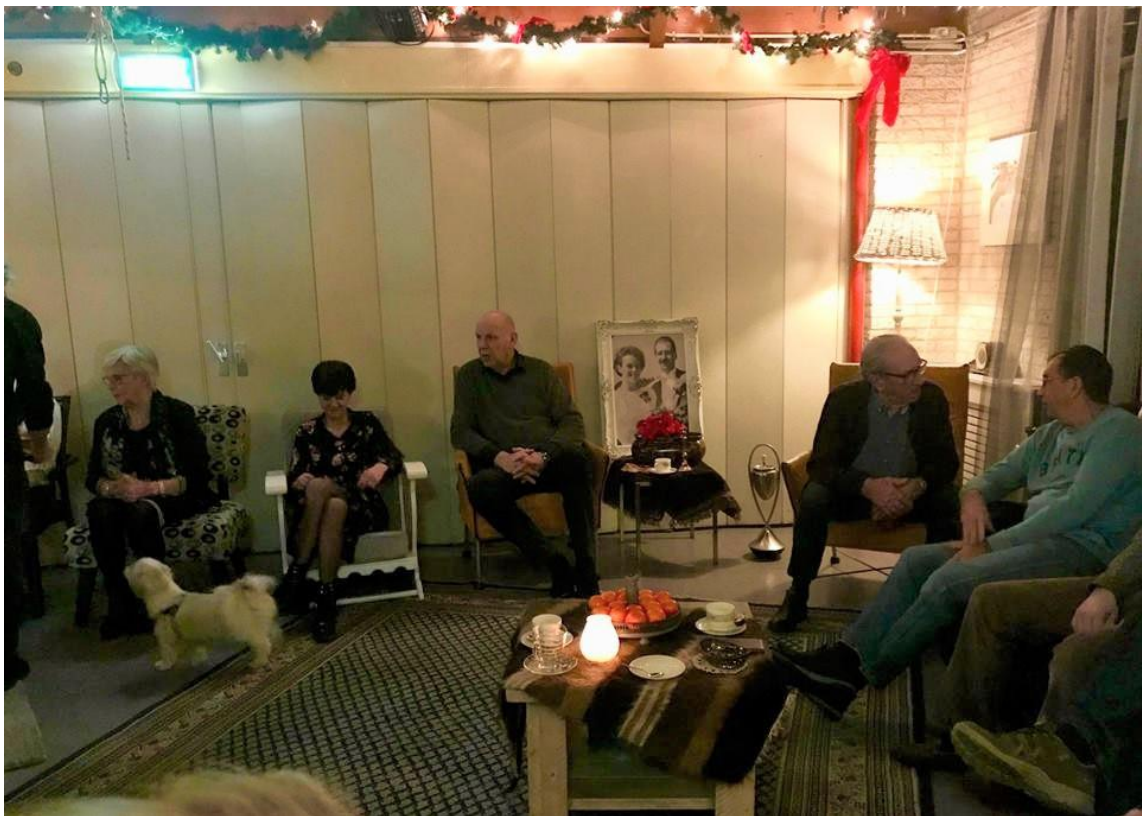
(20) De Vierkap INFO Winter 2018.