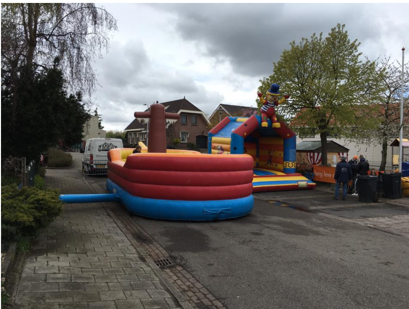
(21) De Vierkap INFO Zomer 2018.