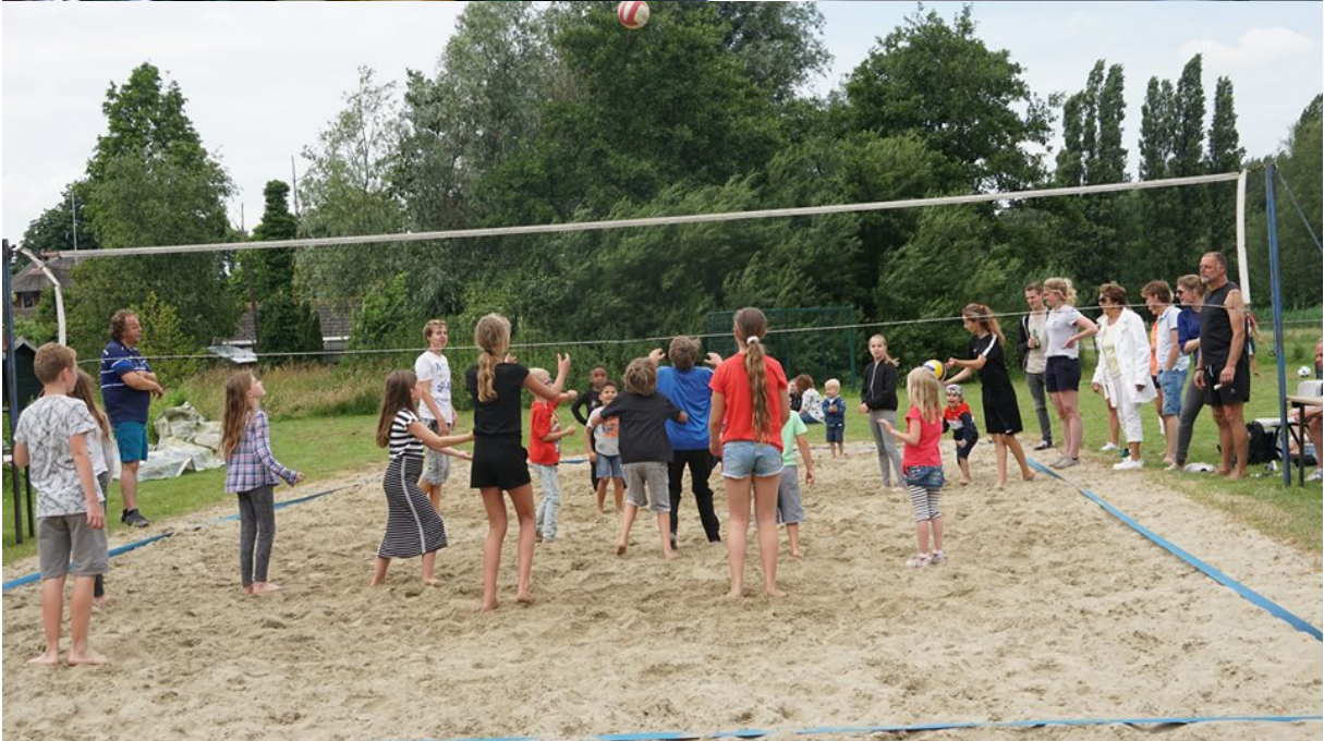
(23) De Vierkap INFO Zomer 2018.