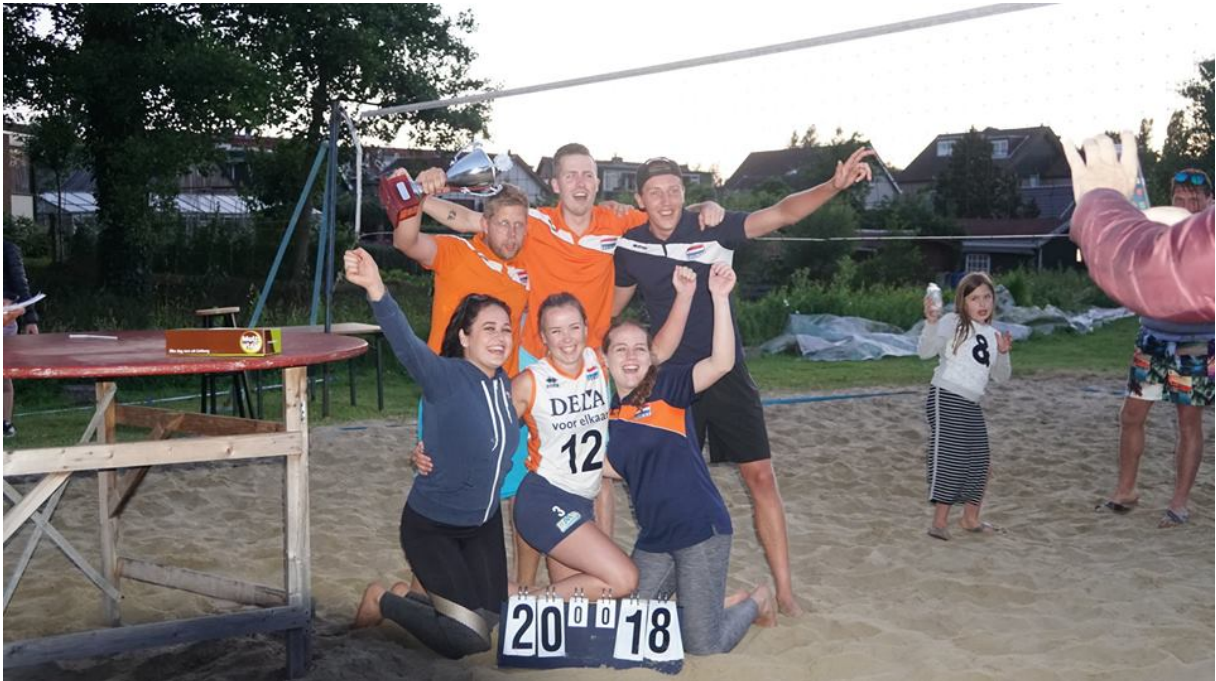
(24) De Vierkap INFO Zomer 2018.