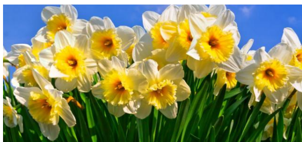
(1) De Vierkap INFO Winter 2017.

Kijk voor wijzigingen op de site in de evenementenkalender. Een week van tevoren wordt dit alsnog in de Nieuwsbrief mede gedeeld.