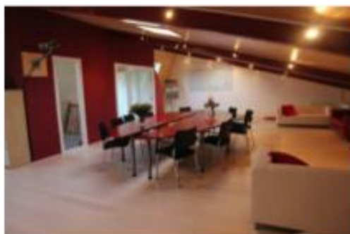
Overzicht over de trainingsruimte

dé locatie voor uw training, workshop, strategiedag of bijzondere vergadering