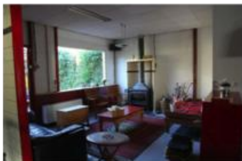
De benedenruimte, huiskamer, pauze, workshopruimte