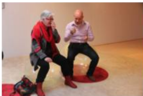
De zitballen zitten comfortabel