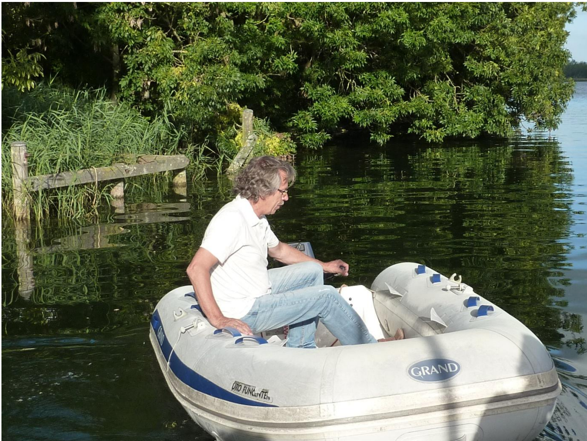
(23) De Vierkap INFO Herfst 2013